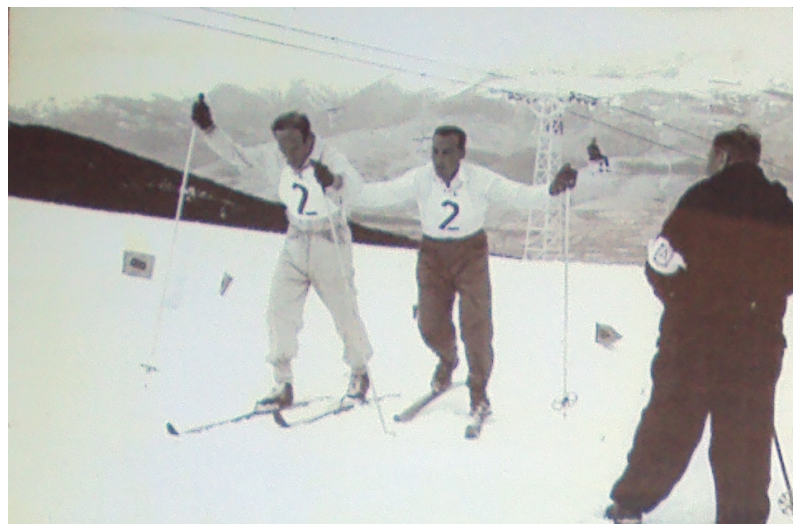
No és un duplicat, és una cursa per parelles

Creixen tota classe de remuntadors, com telesquí de triangle o singles i biplaces de suport cular (“de barra en T”), i fins i tot hi va haver un trineu mecànic on els esquiadors pujaven a banda i banda dempeus, amb els esquís posats, o una mena de trineu telecorda a la Pista Llarga, o el 1964, un telecorda provisional instal·lat a la part alta de Costa Rasa. Arribar així de fàcil al cim del Puig d’Alp obria un nou camp immens als esquiadors, i relegava a “pisteta” a les Standard, l’Estació o la Pista Llarga.