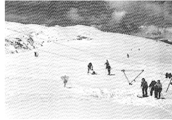
1964, telecorda provisional instal·lat a la part alta de Costa Rasa.

El “ teleou ” original a la Tosa va patir diversos problemes durant la seva vida, però era ràpid i confortable. Un greu accident el 1969 va sentenciar-lo i es va tornar al telesquí. El 1979 es tracta de suplir temporalment l'accés al Niu de l'Àliga amb un nou telecadira, però no s'aconsegueix finançar-lo. Finalment, el 1999 s'inaugura l'actual telecabina de 8 places que arriba fins a l'enllaç amb Masella a la sortida del Jumbo, per sobre del Pla de la Corda, i que s'esperava que el 2011-2012 tornés a arribar, 43 anys més tard, un telecabina al cim de la Tosa i al Refugi del Niu de l'Àliga.