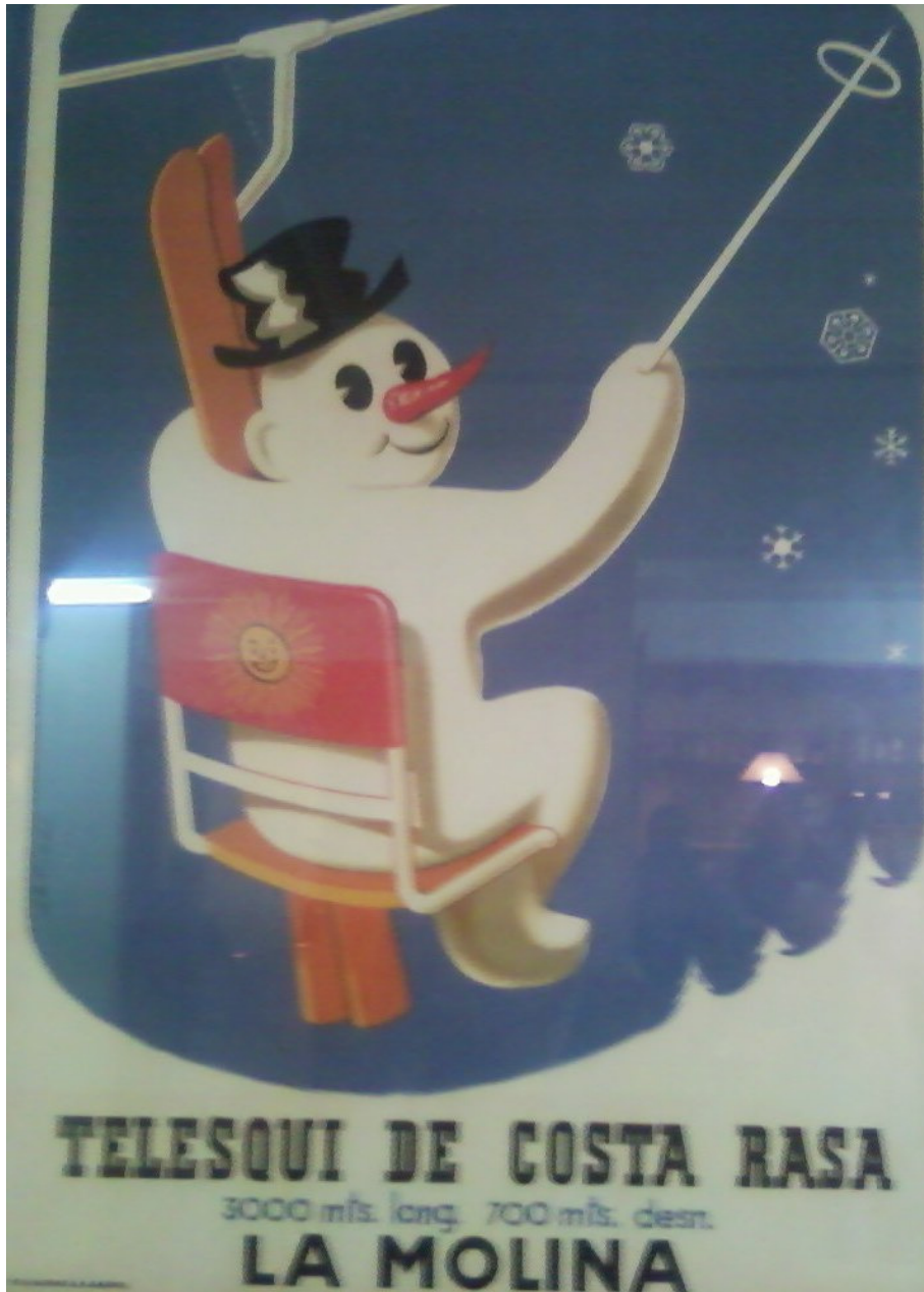
1949, s'inaugura el telecadira monoplaça de Costa Rasa, encara que el cartell deia telesquí. Dibuix d'Artigas