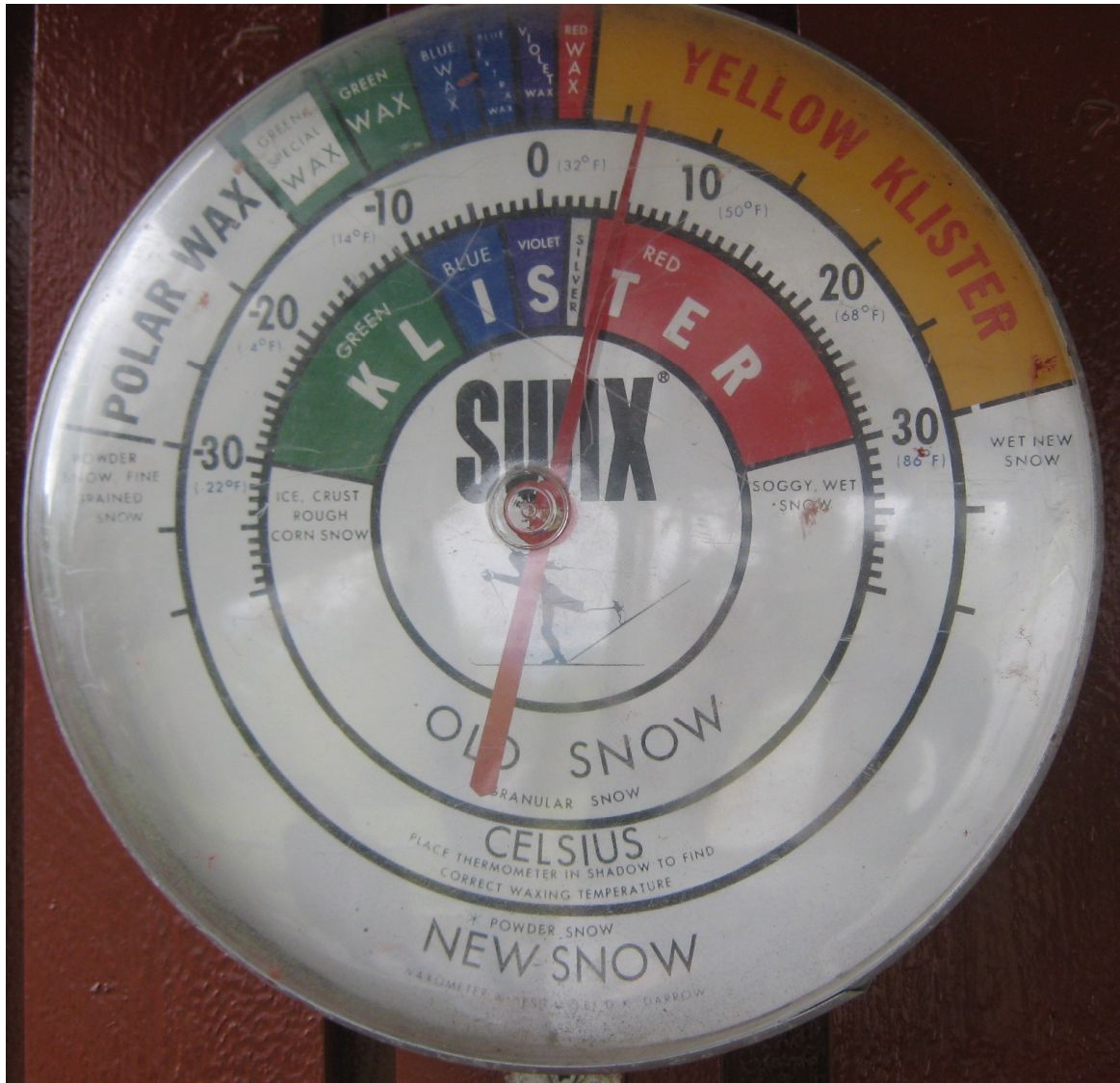
Holmenkollen, Oslo, seu del mundial 2011 de nòrdic: ús de ceres segons temperatura i estat de la neu, 25-9-10

Creixen tota classe de remuntadors, com telesquí de triangle o singles i biplaces de suport cular (“de barra en T”), i fins i tot hi va haver un trineu mecànic on els esquiadors pujaven a banda i banda dempeus, amb els esquís posats, o una mena de trineu telecorda a la Pista Llarga, o el 1964, un telecorda provisional instal·lat a la part alta de Costa Rasa. Arribar així de fàcil al cim del Puig d’Alp obria un nou camp immens als esquiadors, i relegava a “pisteta” a les Standard, l’Estació o la Pista Llarga.