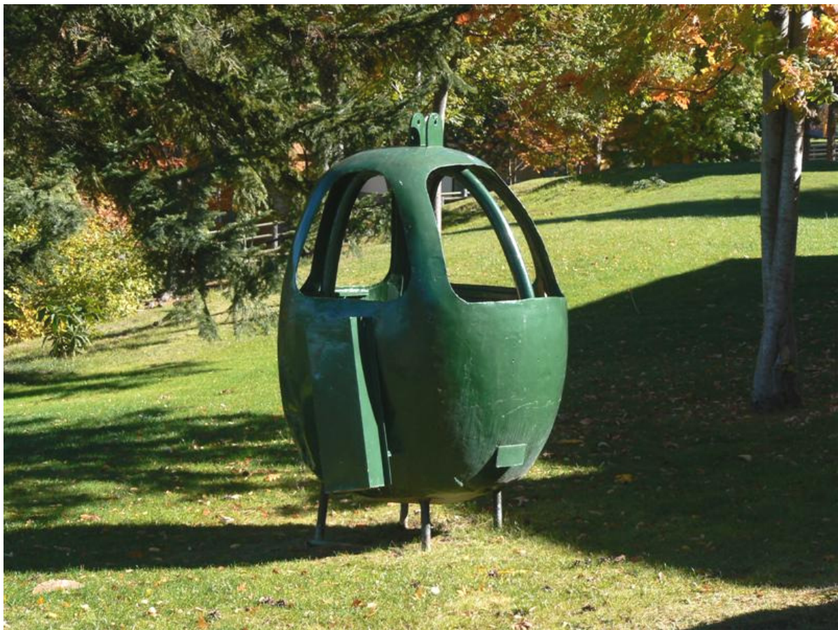
2007, un ou de la Tosa, ornament de jardí, pintat de verd. Els originals eren vermells

Passejant per la zona urbanitzada de l'estació podem veure les antigues cabines del telecabina que pujava a la Tosa, que han acabat convertides en papereres de deixalles o, les que han tingut més sort, en porxos o jardins com a element ornamental, com a la casa al costat de la baixada a Cap de Comella o la que hi ha pujant cap a Bodysport Molina, a la dreta. Un ou vermell restaurat, en perfecte estat, el 24, el trobem a l'entrar al Museu-Exposició, a la dreta.