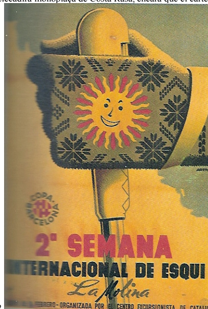
1949, 2a Setmana Internacional d'Esquí, 26-1 al 1-2