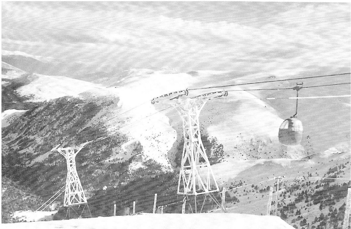
1962, l'ou a la Tosa d'Alp. Un malaurat accident deixarà sense ús el seu accés en telecabina durant 43 anys (si es compleix el projectat).

El “ teleou ” original a la Tosa va patir diversos problemes durant la seva vida, però era ràpid i confortable. Un greu accident el 1969 va sentenciar-lo i es va tornar al telesquí. El 1979 es tracta de suplir temporalment l'accés al Niu de l'Àliga amb un nou telecadira, però no s'aconsegueix finançar-lo. Finalment, el 1999 s'inaugura l'actual telecabina de 8 places que arriba fins a l'enllaç amb Masella a la sortida del Jumbo, per sobre del Pla de la Corda, i que s'esperava que el 2011-2012 tornés a arribar, 43 anys més tard, un telecabina al cim de la Tosa i al Refugi del Niu de l'Àliga.