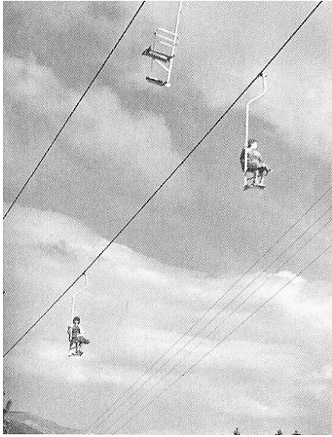
Telecadira de Costa Rasa