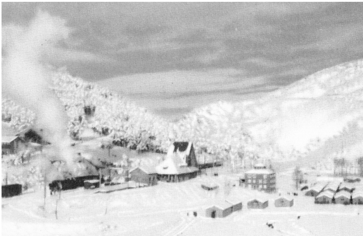
1953, barri de l'estació després d'una gran llevantada, el principal aliat de l'esquí a La Molina.

llargada dels temps dels pioners romàntics, i, com no, les taules dels esquís, de llargades que superen els dos metres (avui sols imaginable per als que fan salts de trampolí) comencen a separar-se en durs i tous, segons el tipus de neu a que estan destinats (pols, glaçada, primavera, verge...), el que busquen els esquiadors (schuss, viratges curts, viratges amples...), el pont i el tipus de pes dinàmic (pes dintre, dolent, o pes fora, bo), l'ús de les ceres numerades, toves (“ Klister ”, enganxoses) o acolorides (grogues, vermelles o grises segons la temperatura, l'estat i el tipus de neu), ... (“Esquí actual”, 1959). Alhora, la roba es va alleugerint i fent-se més fàcilment portable (especialment les jaquetes, que evolucionen de la llana tradicional i corbata masculina o faldilles femenines a l'ús progressiu de les fibres artificials i a l'anorac de ploma, fins a les actuals fibres tèrmiques antihumitat, transpirables, antisuor o wind-stoppers, i passant també dels antics pantalons de golf o de caçador als pantalons de tub típics dels '70, les granotes (“ monos ”) dels '90 i als actuals, artificials i lleugers.