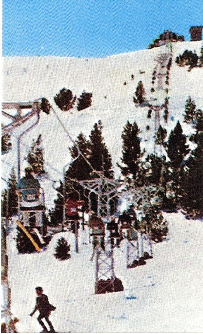
1965, podria ser l'antiga cadira d'un del Roc