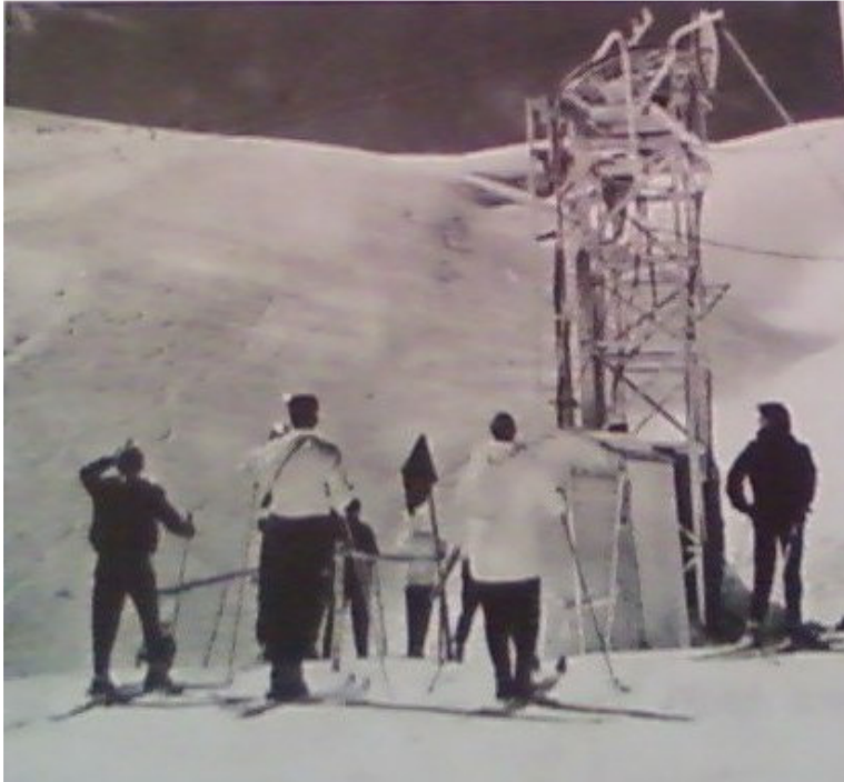
Un dia perfecte, soletat