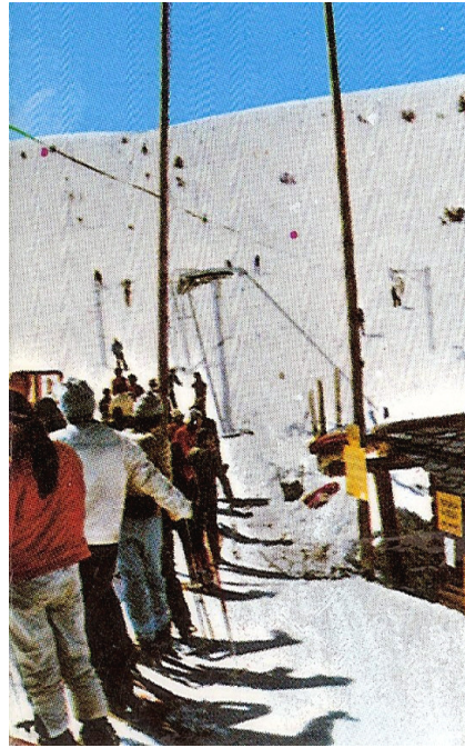
1965, cua al remuntador

Passejant per la zona urbanitzada de l'estació podem veure les antigues cabines del telecabina que pujava a la Tosa, que han acabat convertides en papereres de deixalles o, les que han tingut més sort, en porxos o jardins com a element ornamental, com a la casa al costat de la baixada a Cap de Comella o la que hi ha pujant cap a Bodysport Molina, a la dreta. Un ou vermell restaurat, en perfecte estat, el 24, el trobem a l'entrar al Museu-Exposició, a la dreta.