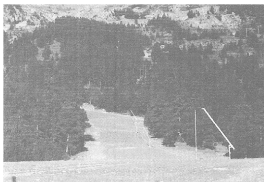
2001, estiu, final de la Volta, a tocar de l'Olimpica