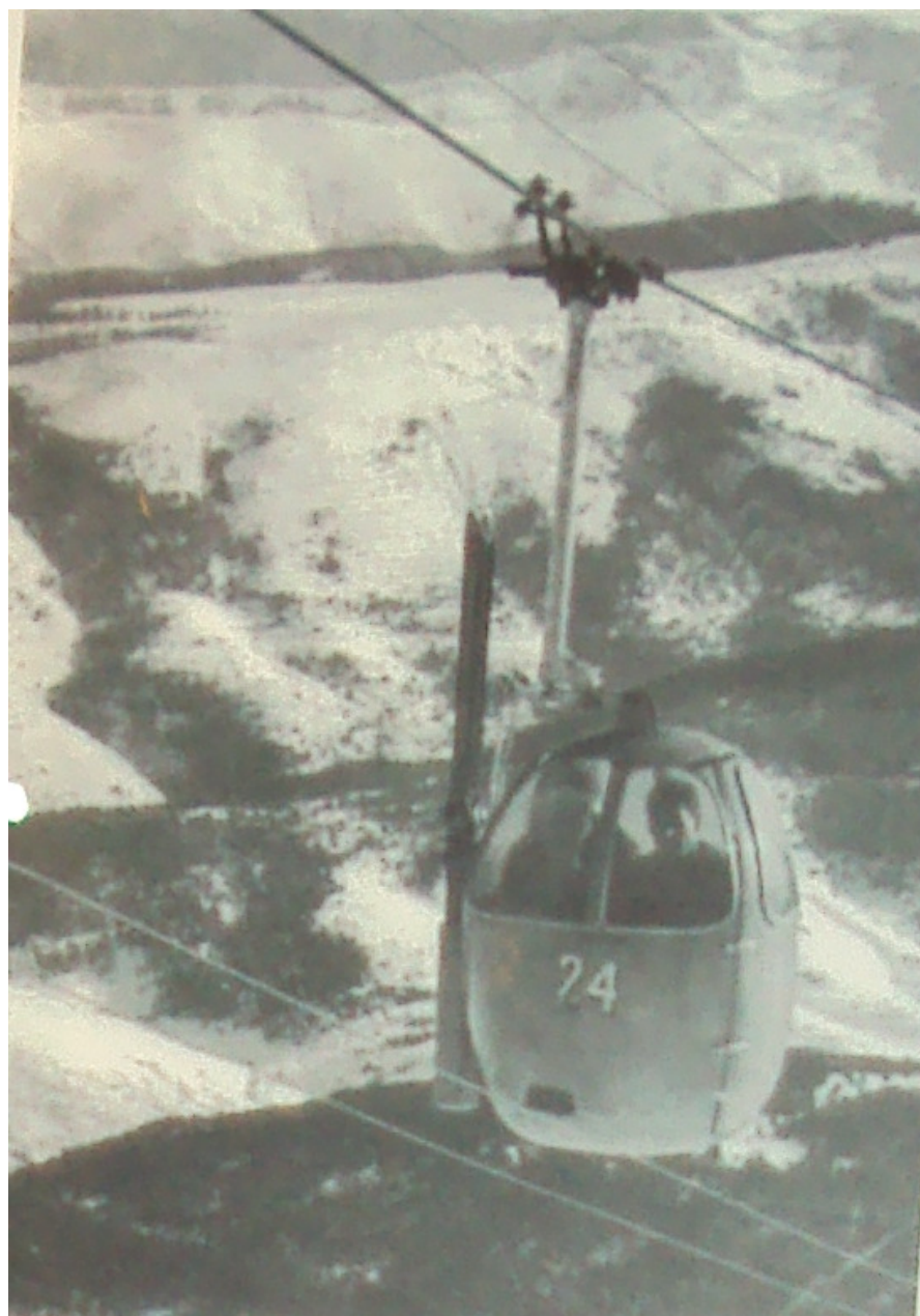
1955, l'ou que avui és al Museu