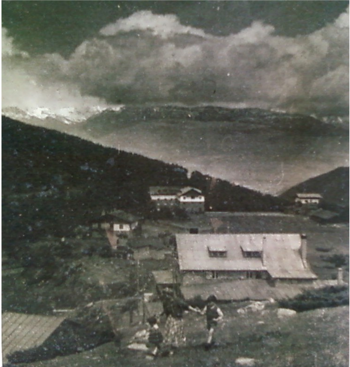
Hotel El Ciervo Blanco