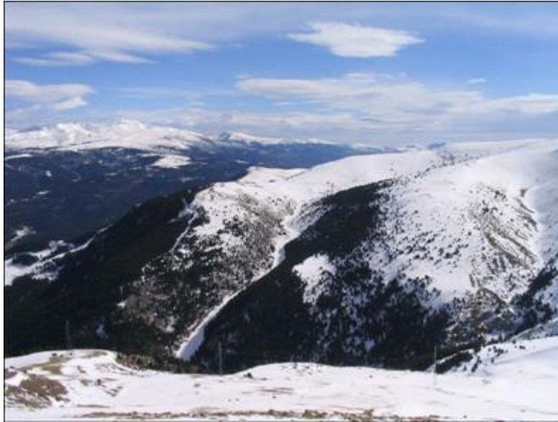
Volta i la pala de Coll de Pal