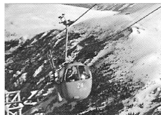
1954, es munta el primer telecabina d'Espanya, un teleou. El 24 es troba avui al Museu