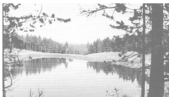
2001, llac artificial de La Molina, emprat per a fabricar neu artificial