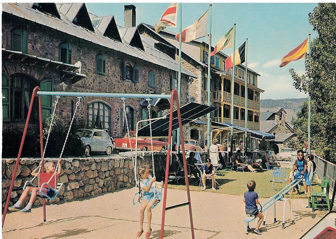
1970, terrassa de l'hotel Adserà