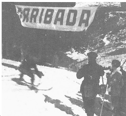
Arribada de cursa

El 1941 es crea la “ Federación Española de Esquí ” (FEDE), com a subseu independitzada i autònoma de la “ Federación Española de Montaña ”, de la qual va ser secció des del 1930, començant un notable creixement del nostre esport a la resta de l'estat, i del seu nivell tècnic. L'arribada de qualificats tècnics del centre d'Europa va permetre fer-hi cursets d'aprenentatge, en els quals va destacar l'austriac Walter Fooger. També ajudaren organitzacions dependents de l'Estat que van col·laborar estretament amb la Federació.