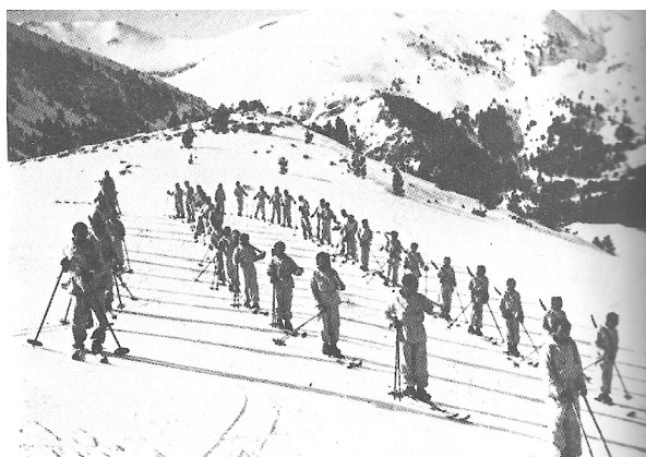
1937, Regiment Pirinenc n° 1 de Catalunya