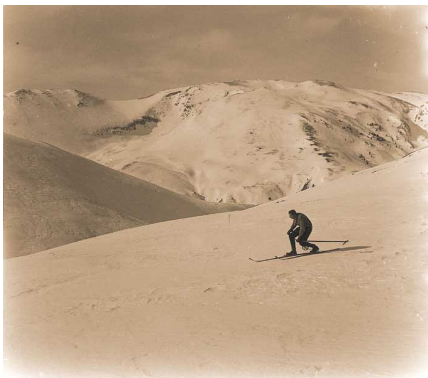
1933 +/-, telemark