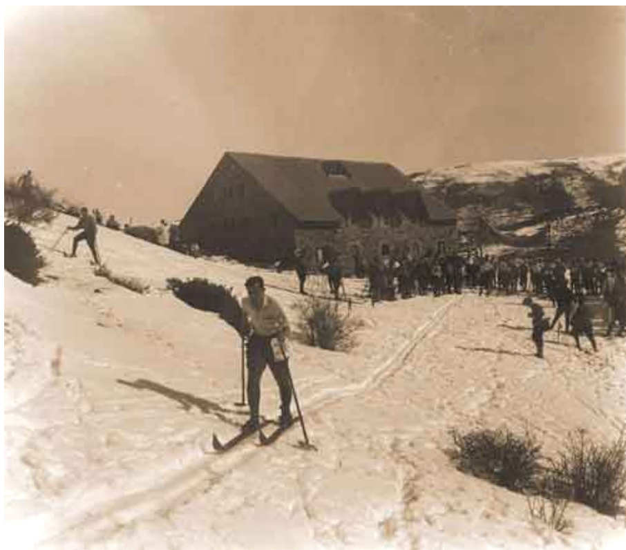
1931, prova de fons

Es tractà de millorar més quan algú va pensar en utilitzar ja la potència dels motors de l'època: s'utilitzà un vell camió sense pneumàtics, que reposava els seus eixos sobre quatre bases de totxanes. Les llandes buides s'empraven per a fer córrer una llarga corretja de cautxú a la que s'agafaven els esquiadors per a tirar amunt. Si hi havien molts i el pes era gran, s'engranava una marxa més curta, per a que la relació de canvi, de més potència, pogués arrossegar els esquiadors. Si n'hi havia pocs, una marxa més alta era suficient. És un sistema arcaic, però enginyós i útil. De fet, ha estat emprat en els orígens de diverses estacions arreu del món.