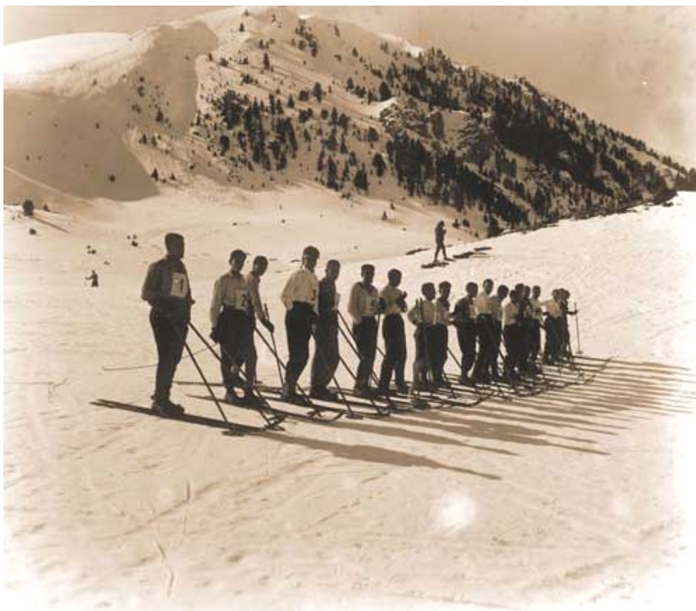
1935, en grup