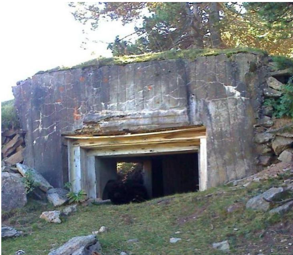
2011, 9-10, bunker d'El Pedró