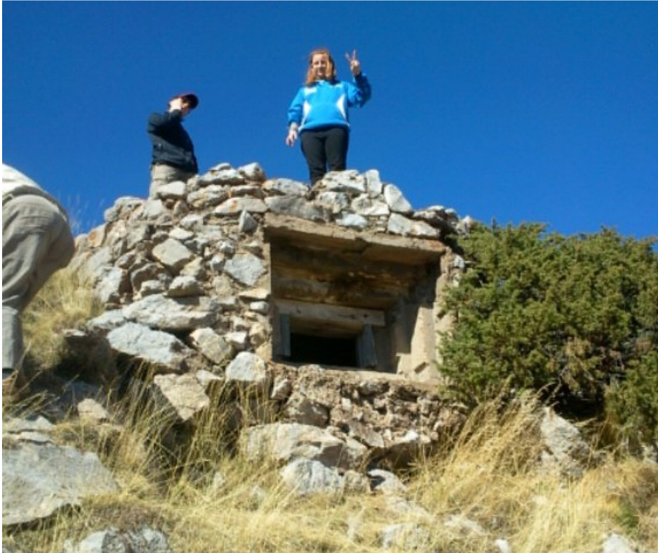
2011, 9-10, bunker d'El Clot de l'Hospital

En acabar el conflicte, molts dels esquiadors de la Companyia, com també alguns del “Batallón de Esquiadores” de l'exèrcit franquista van tornar a esquiar esportivament i junts van ensenyar el que havien après a molta gent que es volia incorporar a la pràctica de l'esquí a La Molina, que torna a funcionar l'hivern 1940-41, tot i que limitats a causa de la postguerra i l'esclat de la Segona Guerra Mundial, que van afectar a l'adquisició de materials, restringint la producció i comercialització d'esquís a uns pocs artesans espanyols o llicenciats (com els esquís Joan Poll Puig, Miret o Roig, les botes Strasser, les fixacions Aniorte, les ceres Nix o Edelweiss...).