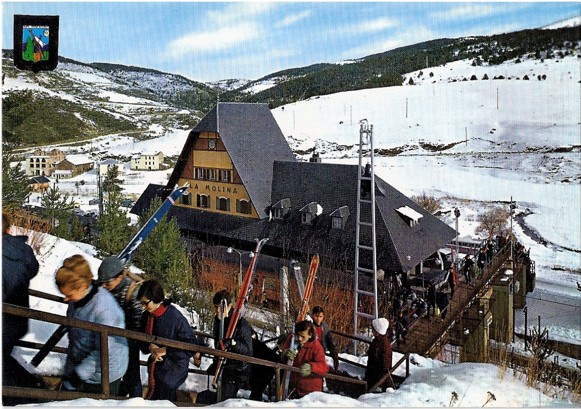
1969, de la RENFE al cadira de l'estació