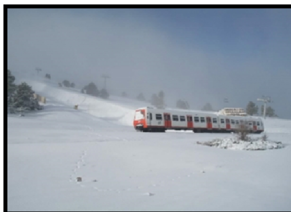
Finals de 2009, Alabaus, el tren