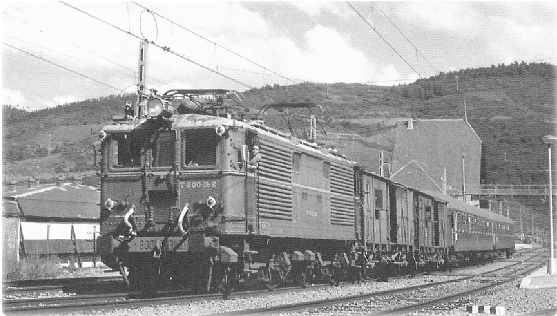
1983, una locomotora elèctrica de la sèrie 1000 que feia el recorregut Ripoll-Puigcerdà. Es parla de recuperar-ne una per a recorreguts turístics