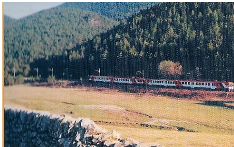
2002, un comboi de dos automotors de la sèrie 440 travessa la vall de les Pletases, al costat del dolmen del Paborde