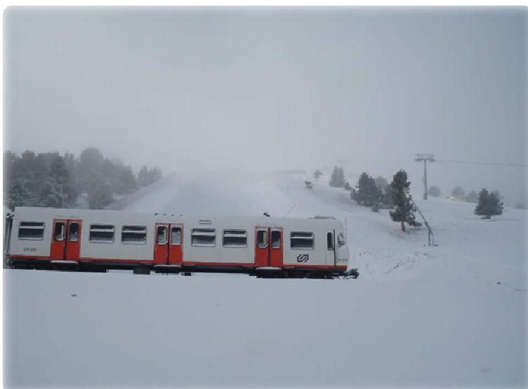
Carrilet dels FGC