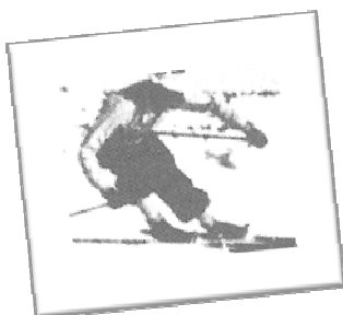
S'ho prenen molt seriosament

Malgrat tot, l'esquí aquí tenia llavors un greu problema: la irregularitat de la neu en cotes baixes a La Molina, que obligà a traslladar moltes proves i campionats a la Vall de Núria, ja definitivament des de la seva XIII edició, encara que a Núria van perdre part