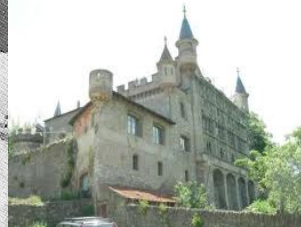
1896, la Torre de Riu, Alp