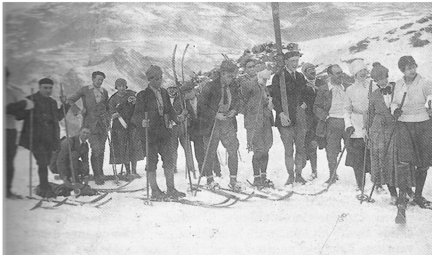
1916, a punt de prendre la sortida a la carretera de la collada.