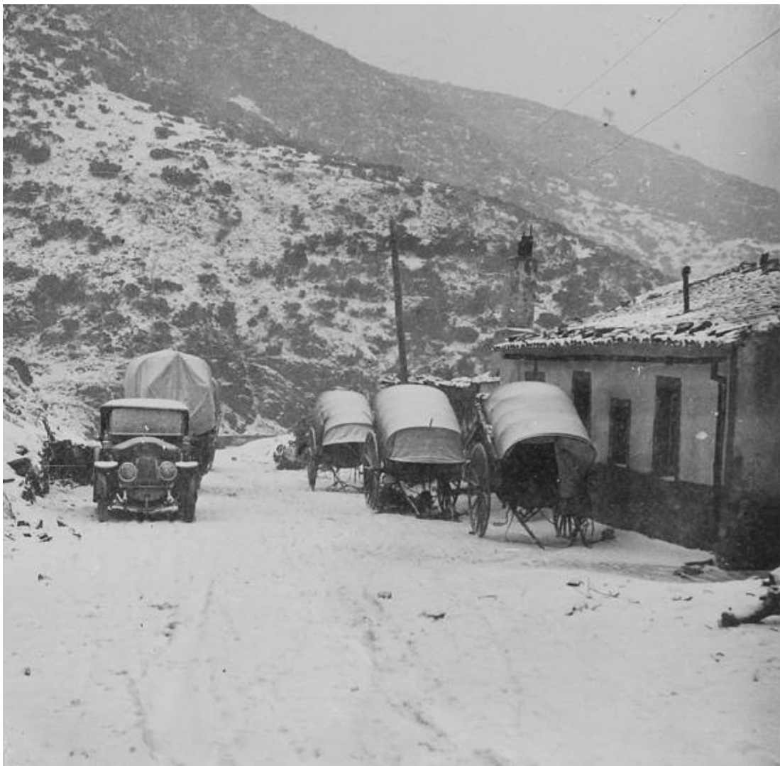
1914, aturada a la cantina de la collada

Els dies 9 a 11/2/1912 celebrem la “Primera Prova Internacional” d’esquí d’Espanya (“Copa Su Majestad Alfonso XIII i Coup Président de la République Française”) a La Molina, amb presència d’esquiadors francesos, austríacs, noruecs, etc., molt més experimentats, en acceptar la Secció l’encàrrec de la Fédération Internationale Franco-