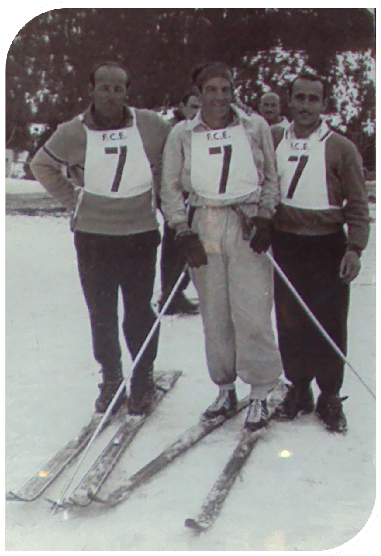
També es feien curses de relleus per equips