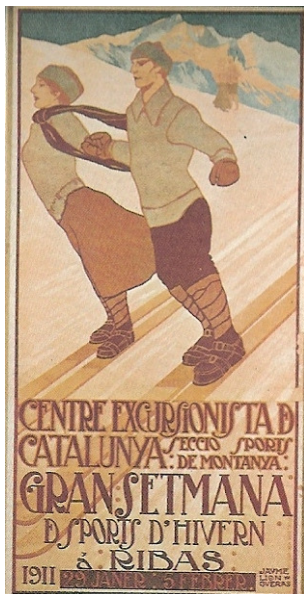
1911, a Ribes, Gran Setmana d'Esports d'Hivern, del 29-1 al 5-2, III gral. i I d'esquí