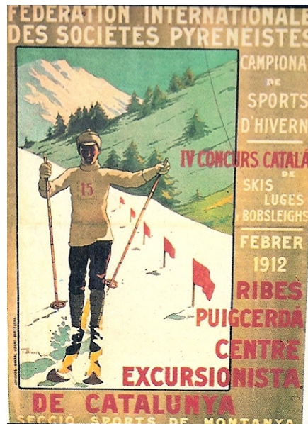
1912, 9 al 12-2, IV concurs català i I internacional