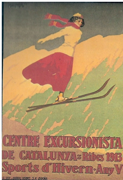
1913, a Ribes, 5è any ja de Concursos

d'aquell aire de festa major que els havia caracteritzat. Però la progressió de la pràctica de l'esquí és geomètrica en aquests moments. Malgrat les rudimentàries tècniques que s'empren, la gosadia i capacitat aviat s'assemblen a la temeritat.